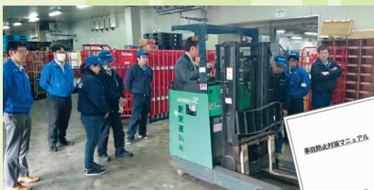
フォークリフト講習会